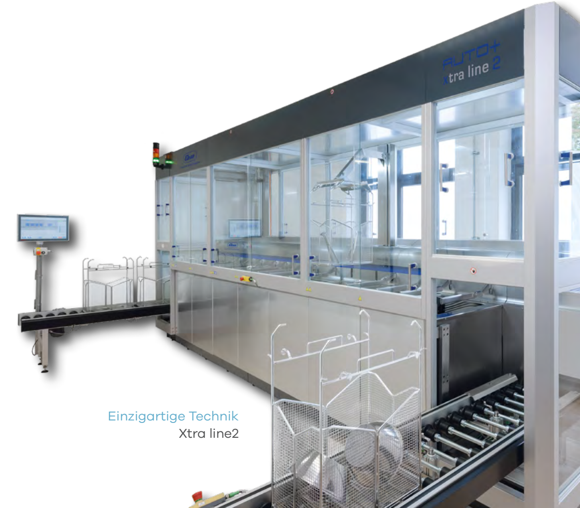
Einzigartige Technik Xtra line2

Durch unser validiertes Verfahren für die Endreinigung und Passivierung von chirurgischen Instrumenten garantieren wir Ihnen eine hohe Prozesssicherheit.